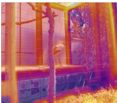
フュージョン画像